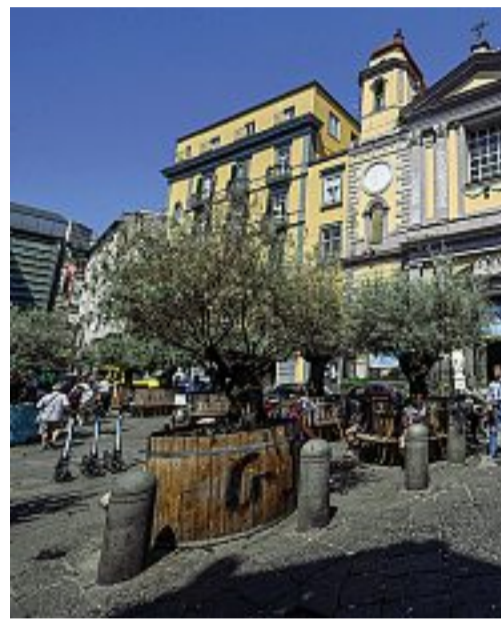
Piazza Montesanto presidiata dagli agenti della Polizia. Sotto, lo stesso luogo poche ore dopo l'episodio di violenza che ha indotto i turisti e i passanti a trovare riparo nei negozi. Nella pagina accanto alcuni frame di video che ritraggono un uomo con il kalashnikov